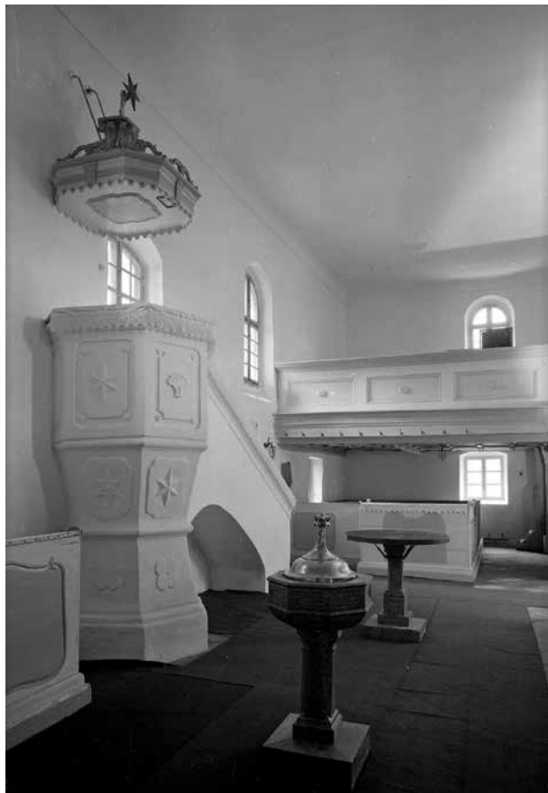
3. Balatonkenese, református templom, templombelső a karzattal és a szószékkel. Fekete-fehér fényképfelvétel Magyar Építészeti Múzeum–Műemlékvédelmi Dokumentációs Központ, Fotótár, ltsz. 128.914N

hogy a veszprémvölgyi apácák is emeltek birtokaikon templomokat. E feltevés annál is inkább jogosult, mert e monostor éppen akkor jutott a balatonparti összefüggő földterület birtokába, amikor Magyarországon István király szavára a templomépítés megindult. E templommaradványok régészeti feltárása tehát nem lenne érdektelen görög monostoraink tárgyi emlékananyagának megismerése szempontjából. 4