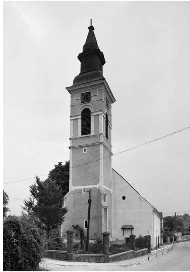
2. Balatonkenese, református templom nyugat felől. Fekete-fehér fényképfelvétel Magyar Építészeti Múzeum és Műemlékvédelmi Dokumentációs Központ, Fotótár, ltsz. 128.911N

nyi mellé a fentiek alapján a kenesei egykori képe is az „ismertek”-hez sorolható. Az ismertek szót azért szükséges idézőjelbe tenni, mert a három templom közül egyiknek az eredeti képe sem rekonstruálható minden részletében. A korábban feltárt mámaihoz hasonlóan, a kenesei építése is a 13. század közepére vagy második felére helyezhető. A vörösberényi legkorábbi formáját