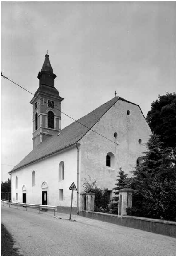
1. Balatonkenese, református templom, déli homlokzat. Fekete-fehér fényképfelvétel Magyar Építészeti Múzeum és Műemlékvédelmi Dokumentációs Központ, Fotótár, ltsz. 128.912N