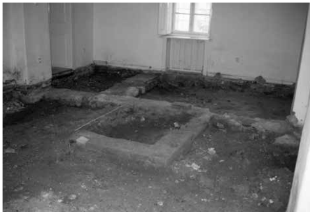
4. Balatonkenese, a paplak korábbi konyhájának visszabontott maradványa

jegyezték fel a gyülekezet naplójában. Az utóbbi mester szereplése arra vall, hogy akkor kerülhetett óra a toronyra.